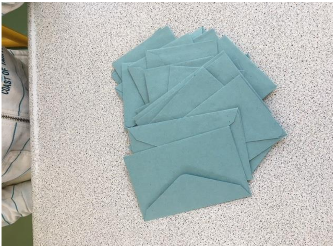
Un élève vérifie que le nombre d'enveloppes correspond au nombre de votants (24).