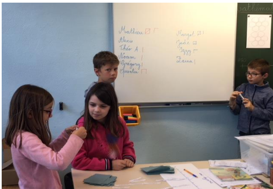
Les filles font le dépouillement, elles ouvrent les enveloppes et disent les prénoms des élèves candidats. Les garçons comptent les voix de chaque candidat.