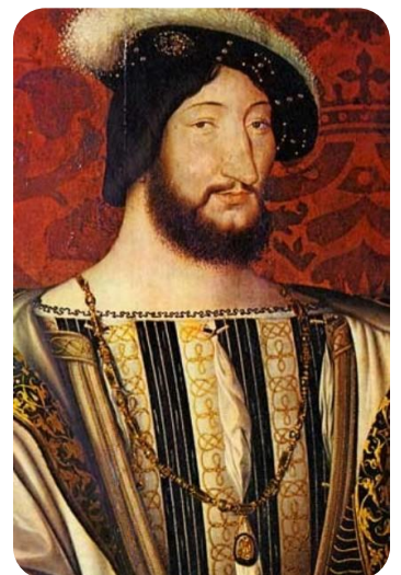
François 1 er (1 er )

Contrairement à d'autres rois avant lui, il décida seul de l'augmentation des impôts .