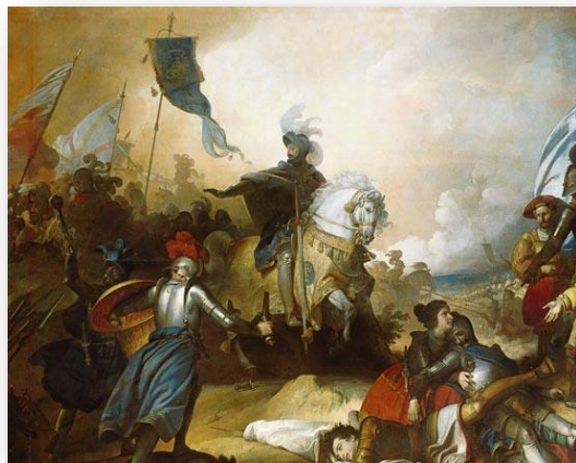
La bataille de Marignan (1515)

Il s'intéressa aussi à l'Amérique , que les Européens venaient de découvrir, et encouragea les explorations , dont celles de Jacques Cartier au Canada .