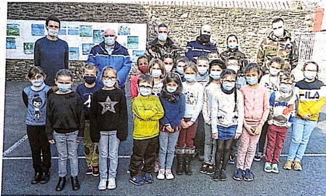
→ Les élèves de CE1 et CE2 aux côtés des gendarmes venus les remercier pour leurs cartes de Noël.