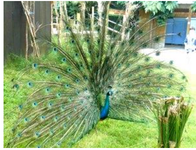
Classe des Petits-Moyens