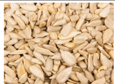
24 - tournesol