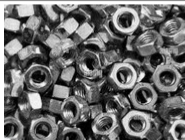
23 - écrous métal