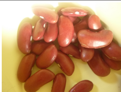
9 - haricots rouges