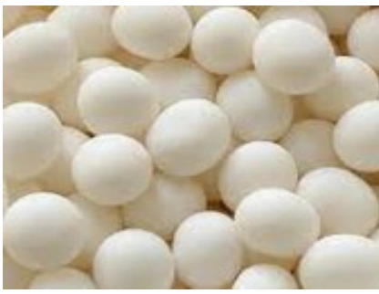
18 - bonbons blancs