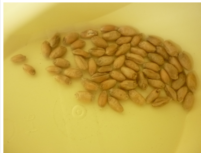
7 - blé