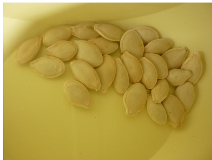
6 - courge