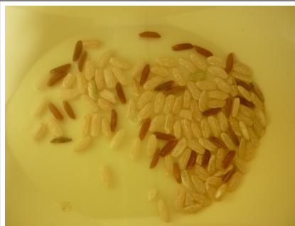
10 - riz