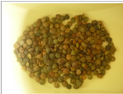
3 - lentilles