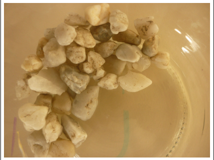
2 - gravier