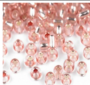
16 - perles