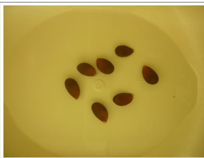
4 - pépins pomme