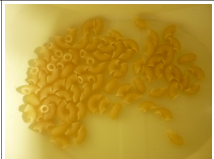
11 - coquillettes