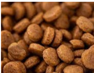
12 - croquettes chat