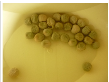
5 - petit pois