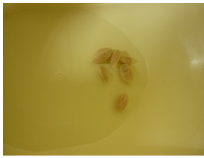
1 - pépins citron