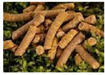
15 - granulés carpe