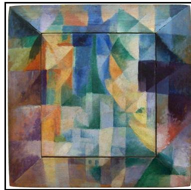
« Fenêtres simultanées sur la ville » (1912)