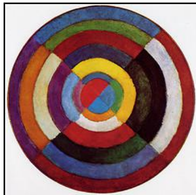
« Disque simultané » (1913)