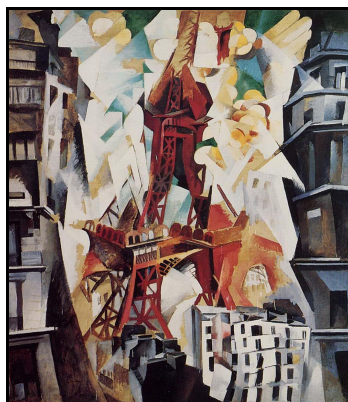
Tour Eiffel (1911)

Dans la classe, nous avons principalement étudié son œuvre :