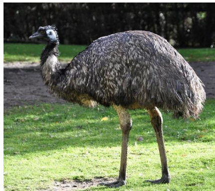
l'émeu