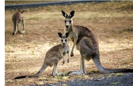
le kangourou