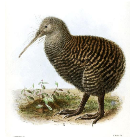
image wikipedia le kiwi