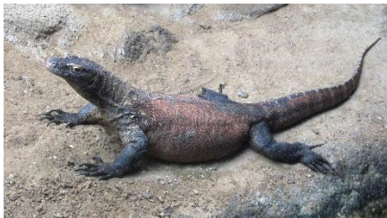
le varan