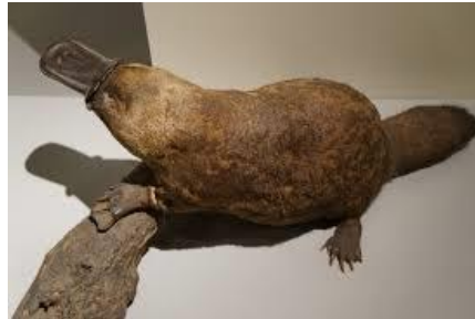
l'ornithorynque