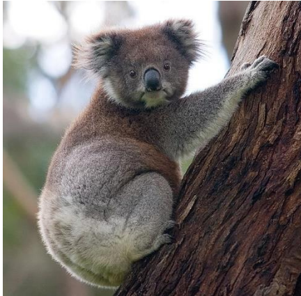
le koala