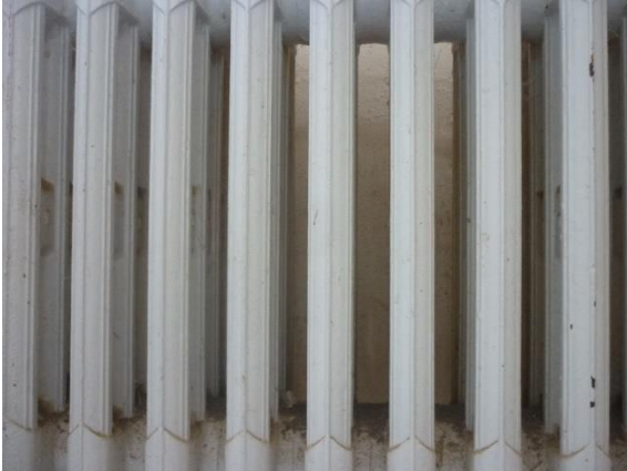
des lignes verticales

Exemple de graphismes que j'ai photographié chez moi :