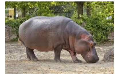
l'hippopotame