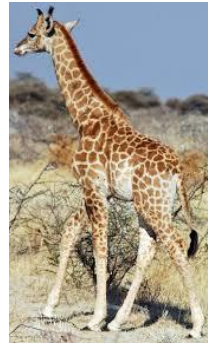
la girafe