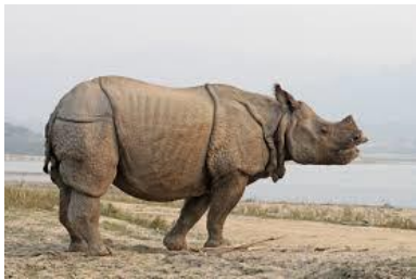
le rhinocéros