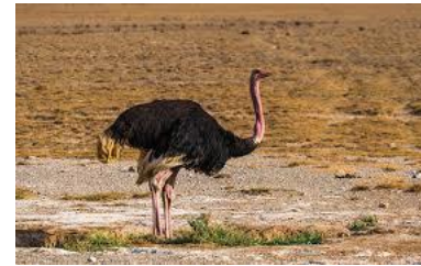
l'autruche