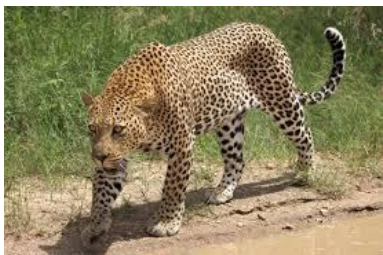
le léopard