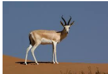
la gazelle