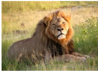
le lion