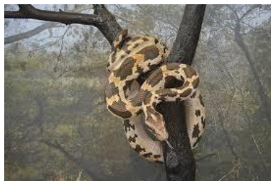
le python