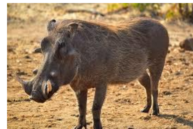
le phacochère