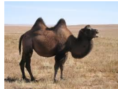
le chameau