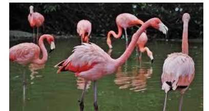
le flamand rose