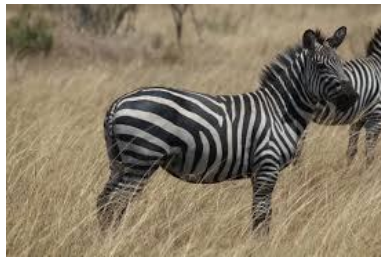
le zèbre