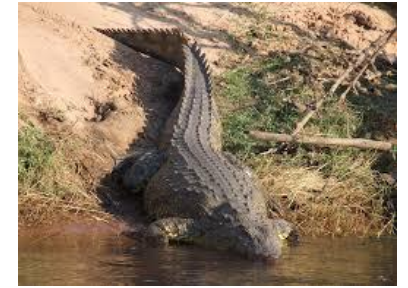
le crocodile