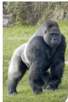
le gorille