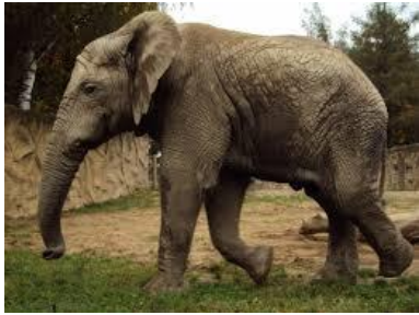
l'éléphant