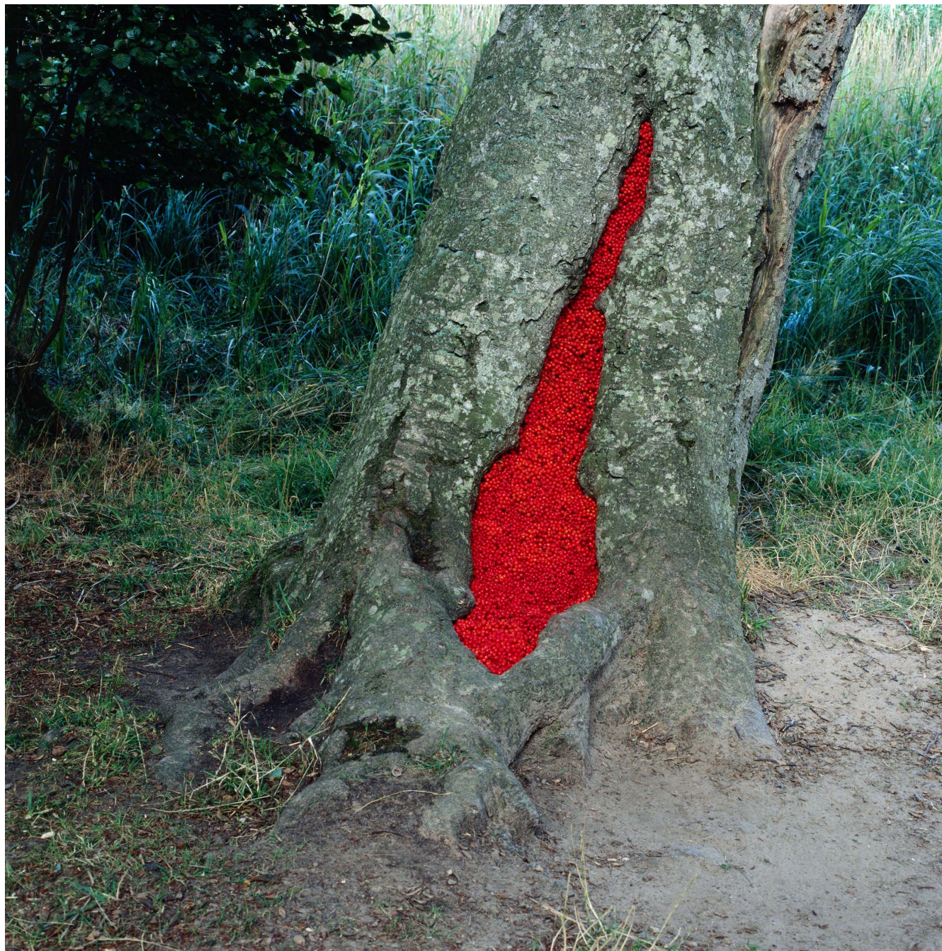
Nils-Udo, sans titre, 1993, hêtre, sorbes, Langeland, Danemark, Ilfochrome sur aluminium, 98x98cm