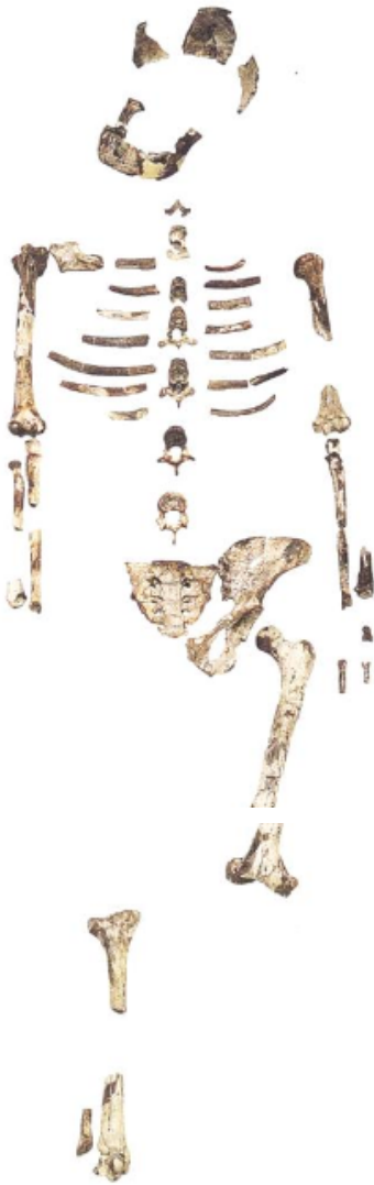
Doc.1. Squelette de Lucy, vieux de 3,2 millions d'années, découvert en Ethiopie.

Les ancêtres des hommes sont apparus sur le continent africain il y a environ 6 millions d'années.