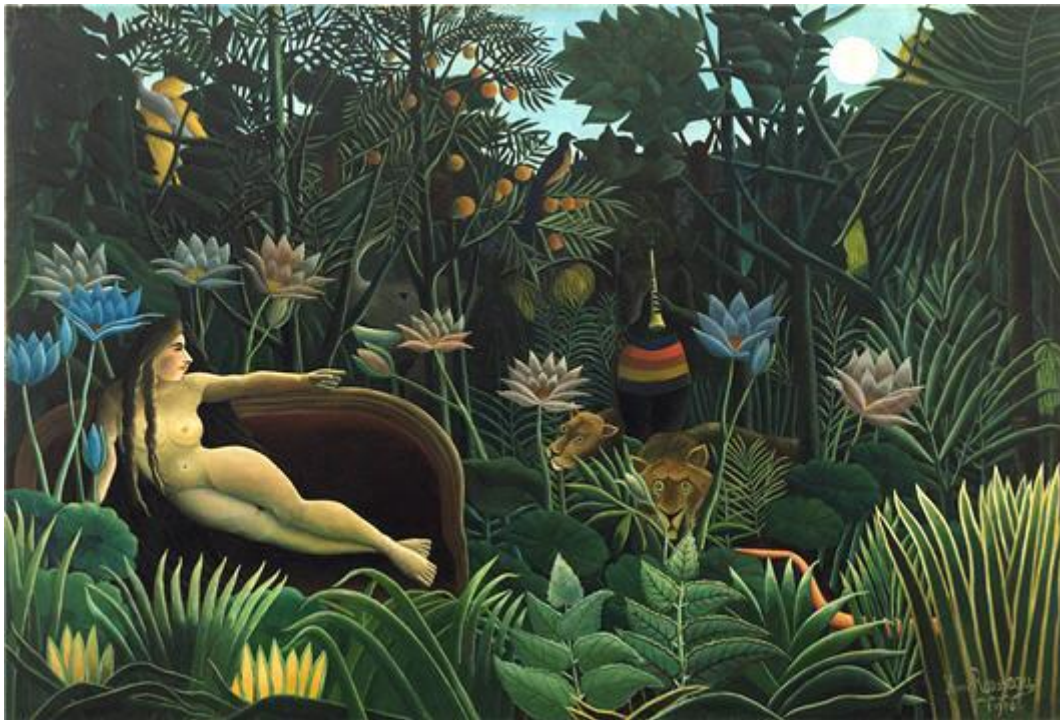
Le Rêve du Douanier Henri Rousseau (1910)