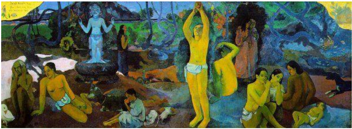
D'où venons-nous ? Qui sommes-nous ? Où allons-nous ? de Paul Gauguin, peint en 1897