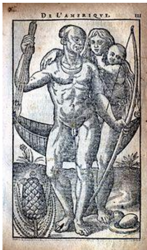
Gravure de l'Histoire d'un voyage fait en la terre du Brésil, 1580, reproduite de l'édition de 1611