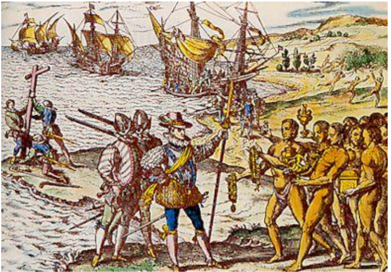
La découverte des Amériques, gravure de Théodore de Bry.