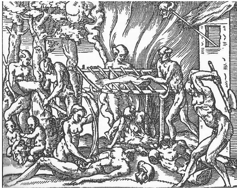
André Thevet, Équarrissage de la victime , Scène d'anthropophagie rituelle des Tupinamba (1557)