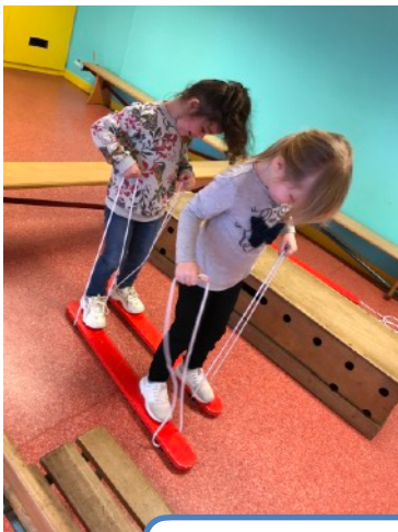
Ski à deux...