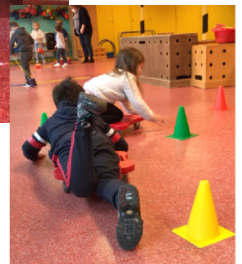
Planches à roulettes...