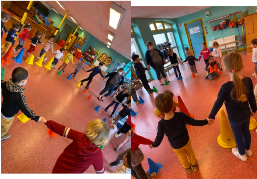
La ronde des musiciens

Première danse du carnaval. La ronde des musiciens.