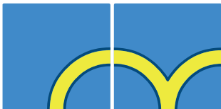
aucune voie sans issue

Variante : pour simplifier le jeu, vous pouvez autoriser les voies sans issue.