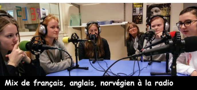
Mix de français, anglais, norvégien à la radio

Il existe depuis 26 ans, et est la plus importante manifestation dédiée aux pays nordiques en Europe. Il propose cette année, des repas norvégiens, des expositions, des initiations au hockey sur glace et à la langue islandaise.