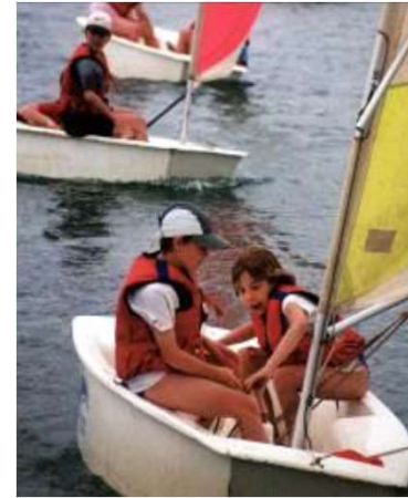
ALLURE : VENT DE TRAVERS