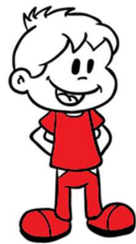
Tenue en partant