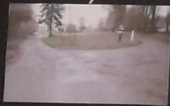
Carrefour (vers la ferme de Sainte-Yvière)