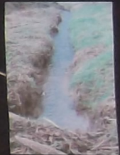
Ruisseau : "La Fontaine Chaude"