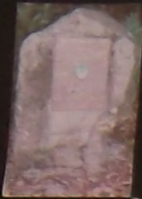
Monument pour le soldat américain mort en 1944