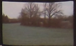
Champ et haies