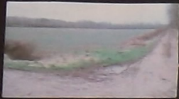
Chemin et champ fermé par des haies