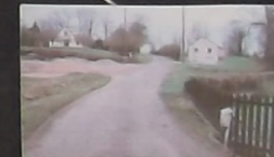
Flameau : "Les Nœs"