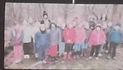
La classe de CM1 - CM2 sur la Pierre Tournoire