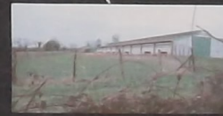
Ferme du Chervet